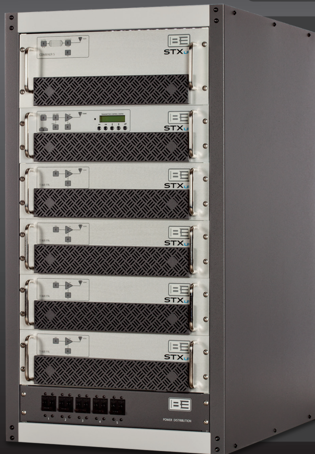
Muestra STX LP 5 kW

•La 2da. generación, incluye un diseño con cambios en las fuentes de alimentación y ventiladores, asegurando una vida aún más larga del transmisor.