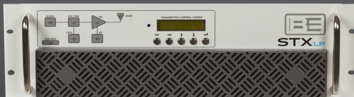
STX LP 1 kW, que es también la principal sección del amplificador controlador / potencia en el 2 kW, 3 kW y 5 kW versiones.

Mediante la utilización de una interfaz CAN, el STX LP Generación II, incluye un controlador integrado en cada amplificador de potencia. Esta particularidad permite que un transmisor de 2kW, 3kW, 5kW pueda ser equipado con doble controlador / excitador. En esta configuración, cualquier controlador / excitador puede funcionar como maestro, asegurando que no exista una interrupción en el aire, ya que el sistema cambia automáticamente al segundo controlador / excitador si es necesario.